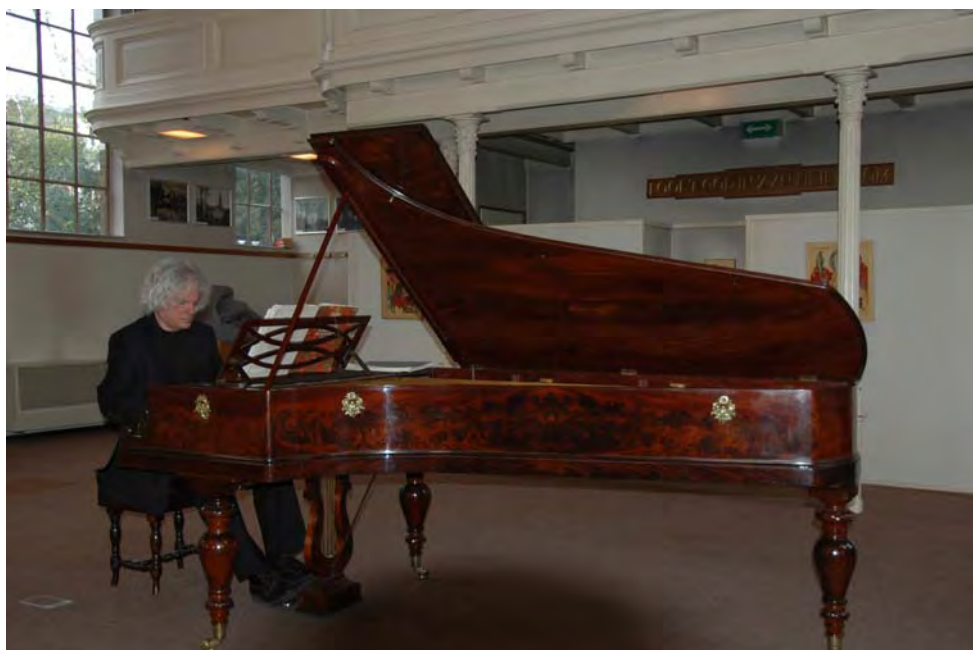
Ronald Brautigam speelt op een Pleyel fortepiano uit 1842