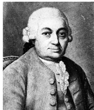
Carl Philipp Emanuel Bach