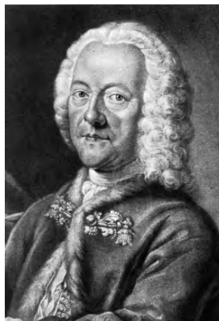
Georg Philipp Telemann