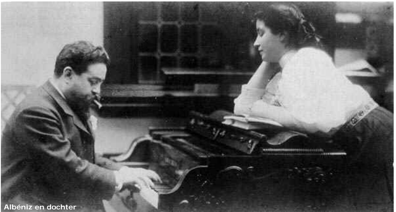
Albéniz en dochter

Grote meesters zoals Debussy, Poulenc en Messiaen roemden de 'Twaalf Muzikale Impressies', zoals de oorspronkelijke titel luidde, vanwege hun diversiteit en het briljante gebruik van kleurrijke dissonantie.